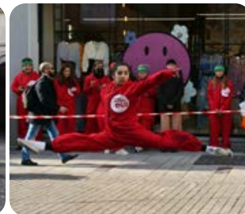
La street dance de la LVC a animé les rues de Lausanne