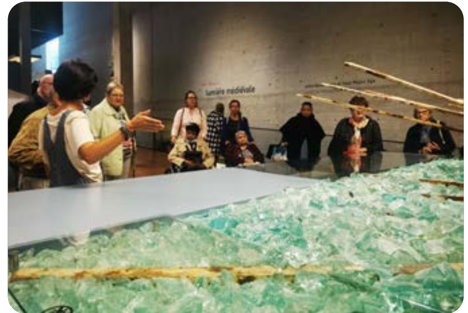
Souvenir d'une journée aérée au Laténium en septembre 2022.

Des cours de Nordic walking ont lieu chaque semaine dans deux régions du canton, durant toute l'année. Cette activité sportive, adaptée aux capacités des personnes ayant des difficultés respiratoires, contribue au développement des relations sociales et a une action positive sur leur santé. Les cours ont eu lieu régulièrement, une vingtaine de participant-e-s y prennent du plaisir.