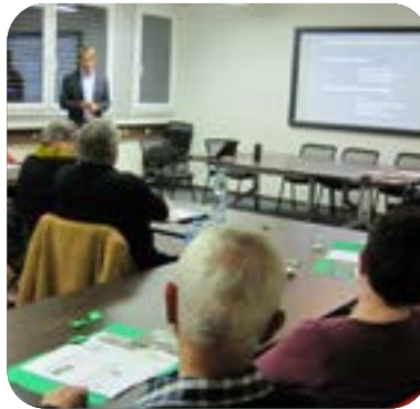
La rencontre CPAP offre des explications médicales pour mieux comprendre les apnées du sommeil.

Les rencontres CPAP ont eu lieu en présentiel avec une agape en fin de rencontre, temps d'échange qui n'était plus possible depuis 2019.