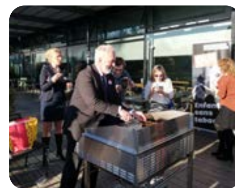
Du cervelas grillé pour fêter le résultat, un clin d'oeil à la campagne du camp adverse.