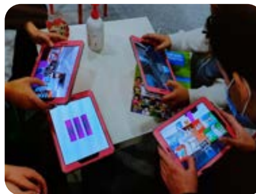
La démonstration à la presse du Splash pub a montré la surexposition de jeunes à la publicité du tabac.