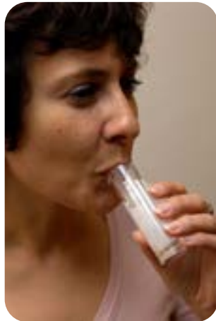
Les prélèvements oraux font partie des tests utiles au diagnostic de la tuberculose.

Sur mandat de la Direction générale de la santé de l'Etat de Vaud (DGS), la Ligue pulmonaire vaudoise contribue à la lutte contre la tuberculose, maladie transmissible à déclaration obligatoire.