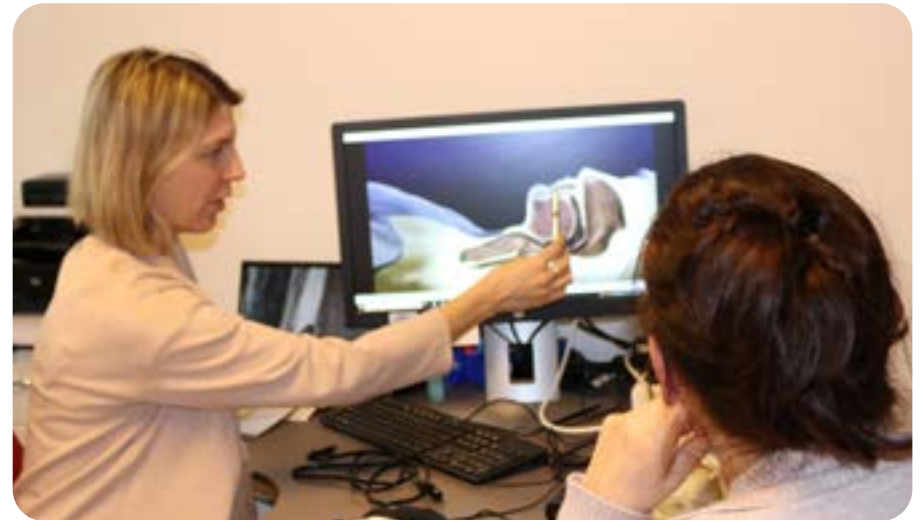
La vidéo est un support utile lors des premières instructions.

Plusieurs nouveautés ont vu le jour dans la région de Nyon. La première est un partenariat avec le cabinet de physiothérapie Jérôme Divrone, dans lequel une salle de consultation CPAP a été ouverte. La seconde concerne l'ouverture d'un cabinet de physiothérapie respiratoire. Cela s'est concrétisé au tournant de l'année 2023.