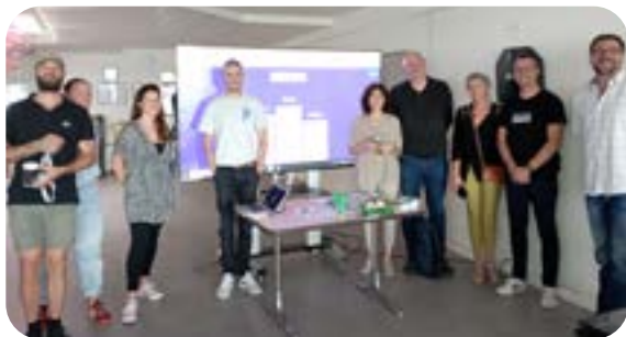
La journée santé au Repuis a permis une sensibilisation ludique.

L'émergence du phénomène des puff bars, cigarettes électroniques jetables, a marqué l'année. L'attrait des jeunes pour ces nouveaux produits semble croissant et leur teneur en nicotine dépasse parfois le seuil légal. Une étude sur leur utilisation a été lancée par nos partenaires Unisanté et Promotion santé Valais, alors qu'aucune réglementation cantonale n'empêche leur achat par des mineurs à la fin de 2022.