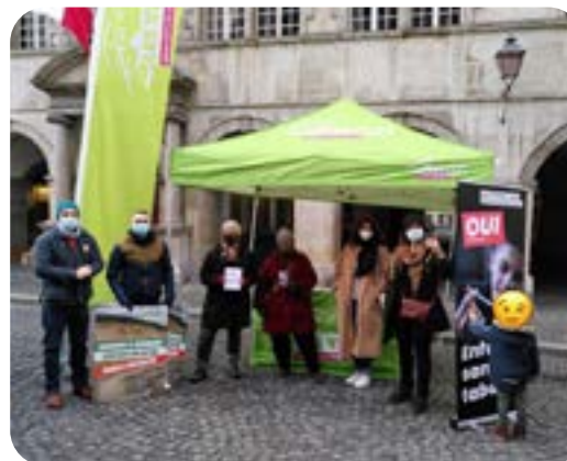
De nombreux partis politiques vaudois ont soutenu l'initiative.